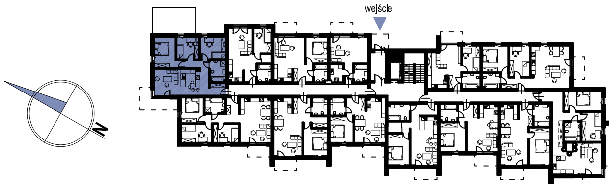
schemat rzutu parteru