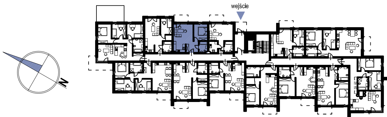
schemat rzutu parteru