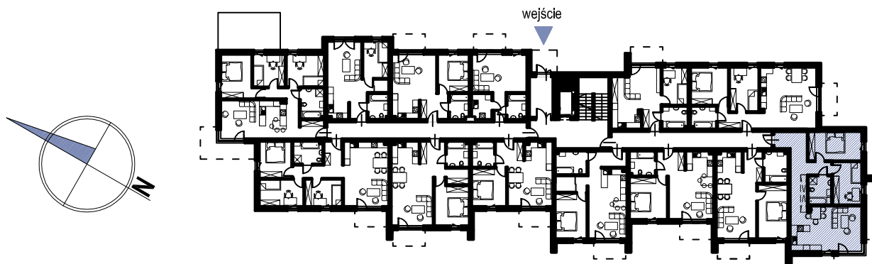
schemat rzutu parteru